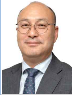
서 양 열