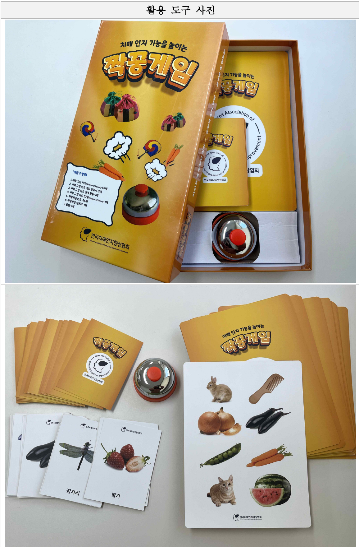
활용 도구 사진